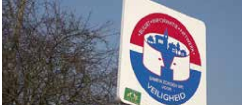
Buurtinformatienetwerken in Roosdaal p.2