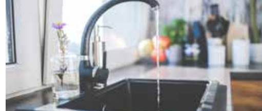
De waarheid over uw waterfactuur p.3