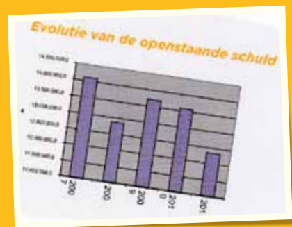
Openstaande schuld volgens CD&V